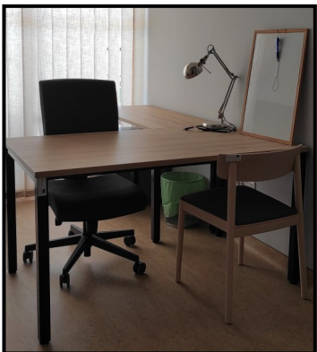
Ured psihosocijalne podrške