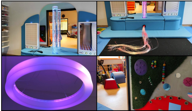
Soba za rekreativne aktivnosti