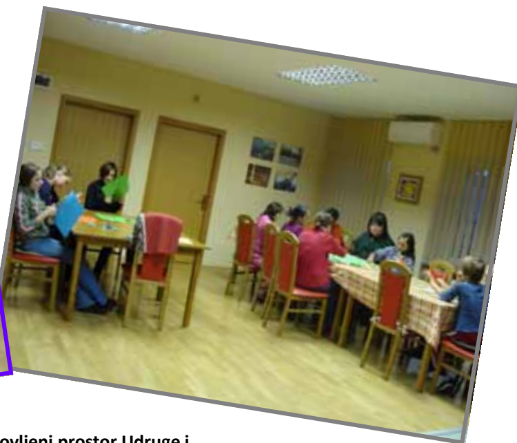
Prošireni i obnovljeni prostor Udruge i vrijedni Mali Klubaši

I oni žele izaći izvan doma, šetati, slušati glazbu, družiti se sa svojim vršnjacima. Svako izbjegavanje uključivanja djeteta s teškoćama u razvoju u sredine izvan kuće, bilo vrtiće i školu ili nakon toga u radionice i na druženja, onemogućava njegov socijalni razvoj i zapravo ga zakida za jedan velik dio njegovog djetinjstva i kvalitetu življenja.