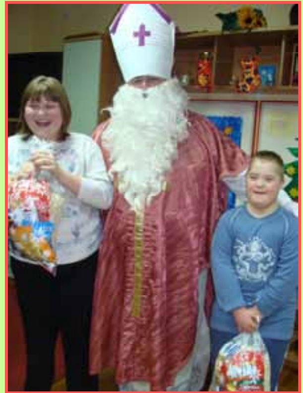
Petra, sv. Nikola i Mario

prirodnih plodova oduševila sve sudionike radionice. Djeca i roditelji izrađivali su eko ukrase kojima su zajednički okitili veliki bor. Nakon ukrašavanja bora druženje je nastavljeno uz božićne pjesme i božićne slastice. (M. K.)