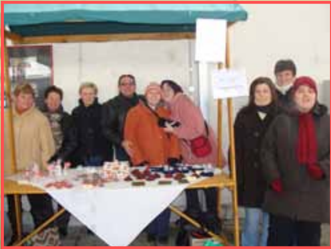
Pomažimo jedni drugima