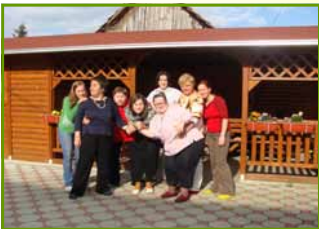
Proslava Aninog rođendana u dvorištu Udruge