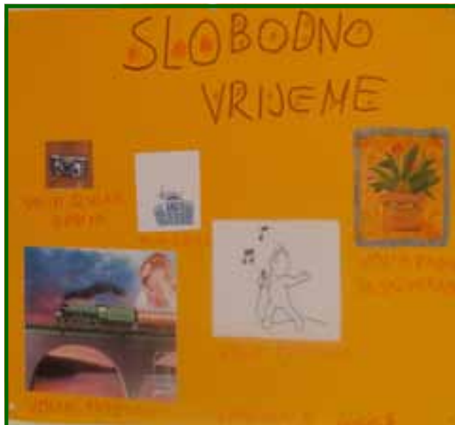
Plakat izradili članovi Velikog kluba

Tijekom sastanaka Velikog kluba korisnici rade na sebi. Pod vodstvom voditeljica jačaju pozitivnu sliku o sebi i usvajaju vještine samozastupanja. U uvodnom ili radnom dijelu druženja razmišljamo o svojim vještinama, vrlinama, uspjesima. Razmjenjujemo komplimente. Razgovaramo o aktualnim problemima i načinima njihovog rješavanja, dijelimo iskustva, pružamo podršku jedni drugima. Uvježbavamo vještinu aktivnog slušanja. Poštujemo različita mišljenja. Razmišljamo o svojim pravima i obavezama, o posljedicama naših odluka, o tome koje odluke možemo donijeti sami, a koje donose za nas naši roditelji. Korisnici se ovakvim pristupom osnažuju, a sudjelovanje u aktivnostima doprinosi razvoju zajedništva grupe. (M. K.)