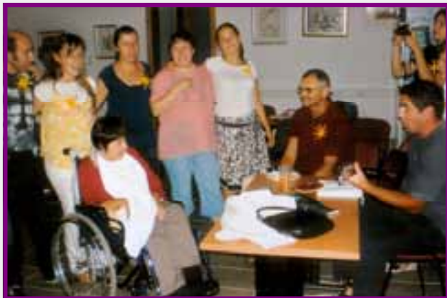
Susret zajednice Vjera i svjetlo