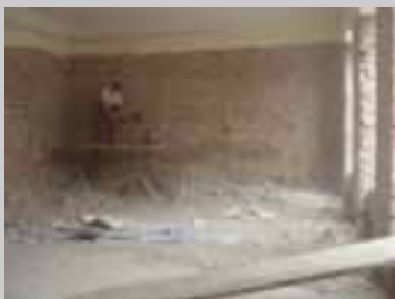
Naš prozor u svijet 2