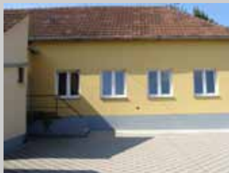
Prošireni i obnovljeni prostor Udruge