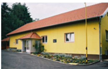
“Ludbreško sunce”, Ludbreg

Zahvaljujući dugogodišnjoj dobroj suradnji s Udrugom „Ludbreško sunce“ naša udruga bila je pozvana na dane Ludbreške Svete Nedjelje. Tako je dio članova 29. kolovoza 2010. išao u Ludbreg, gdje su sudjelovali u euharistijskom slavlju koje bilo posvećeno bolesnima, osobama s invaliditetom, osobama s mentalnom retardacijom te djelatnicima Caritasa.