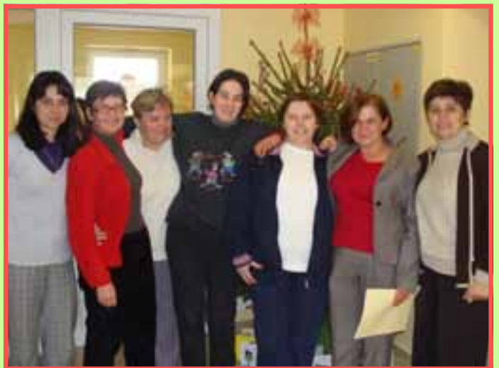
Veselo druženje u Centru za socijalnu skrb grada Đurđevca

Nakon uspješno odrađenog posla slijedi ono najzanimljivije, a to je druženje djelatnika i korisnika uz slatkiše i sokove. (A.Š.)