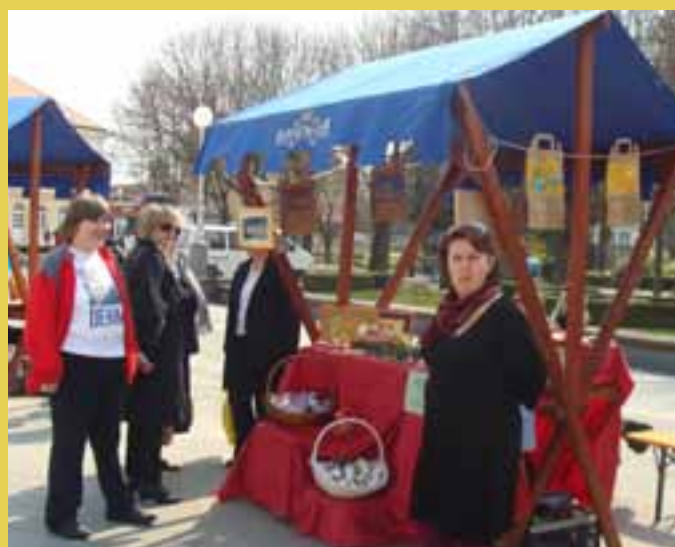
Kampanja Hrvatskog saveza Udruga u Koprivnici