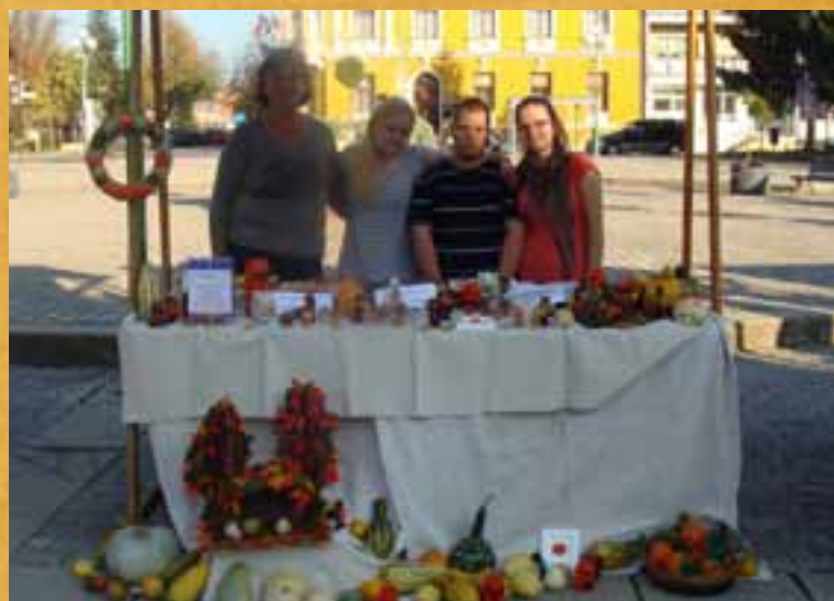
Tikvijada i kestenijada