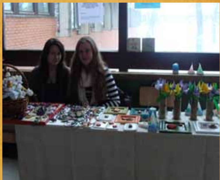
Volonterke u Gimnaziji dr. I. Kranjčeva