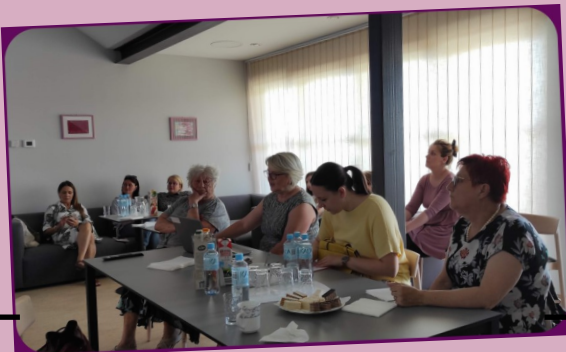
30. lipnja - okrugli stol povodom Dana otvorenih vrata EU projekata uz prezentaciju iskustva u provođenju europskih projekata