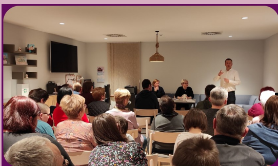
16. ožujka - održana redovna sjednica skupštine o radu tijekom 2022. godine te planu rada za 2023. godinu