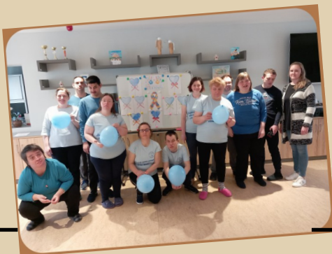
2. travnja - Dan svjesnosti o autizmu