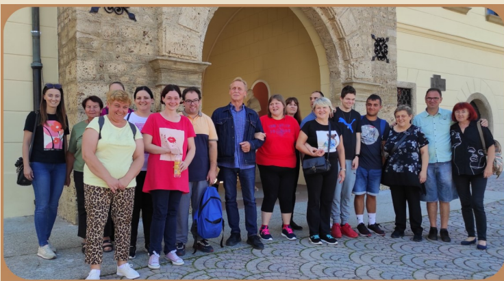
HODOČAŠĆE NA MARIJU BISTRICU