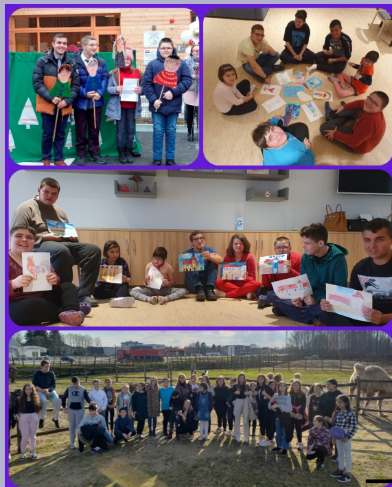
Obilježavanje važnih datuma, posjet Hrvatskoj Sahari s učenicima iz Virja, sudjelovanje na otvorenju novog prostora