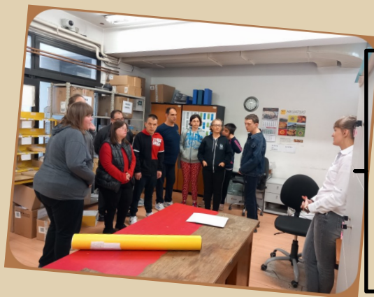
9. listopada - Svjetski dan pošte