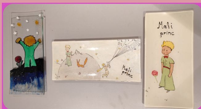
PLADNJEVI MALI PRINC