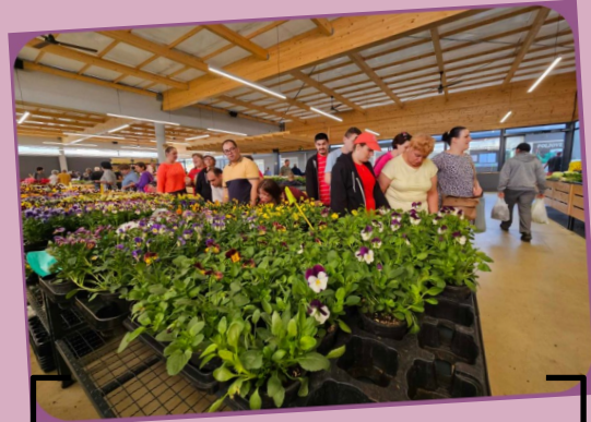
odlazak na tržnicu