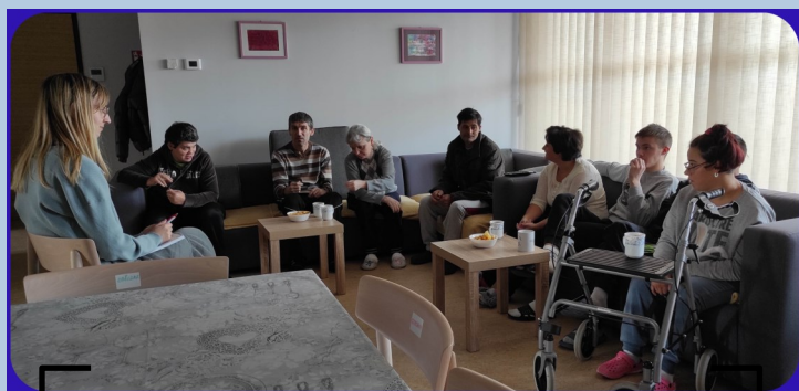
Tjedni sastanak korisnika organiziranog stanovanja uz podršku

Svakodnevica im prolazi u uobičajenim aktivnostima svakog kućanstva - pripremi obroka, održavanju i uređenju prostora, no i u onim najsladima kao što su otkrivanje zanimljivosti grada Đurđevca, odlazak na kavu, vesela šetnja, posjet zoološkom vrtu, kreativne radionice.