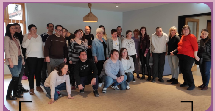
druženje s prijateljima