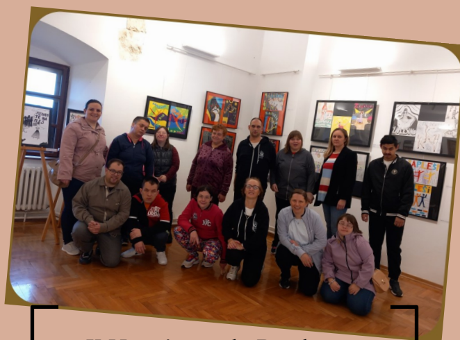
U Muzeju grada Đurđevca