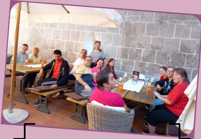
druženje uz kavu