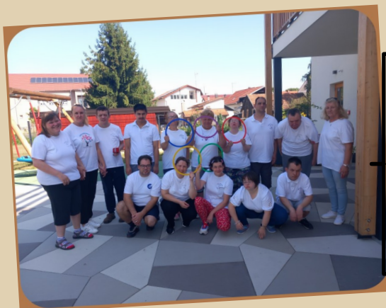
13. rujna - Hrvatski olimpijski dan