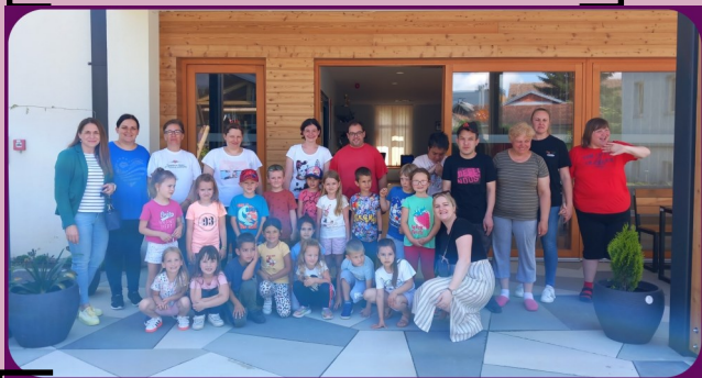
2. lipnja - odgojna skupina Kockice Dječjeg vrtića Maslačak povodom Dana otvorenih vrata