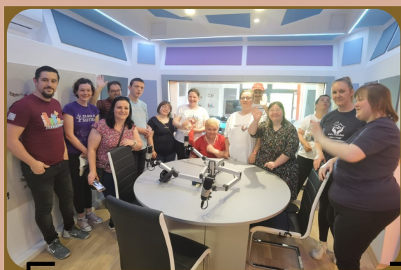
Posjet Podravskome radiju