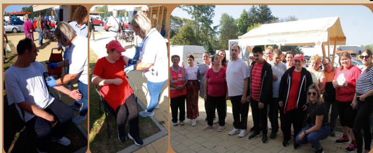
29. rujna - Svjetski dan srca