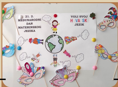
21. veljače - Međunarodni dan materinskog jezika