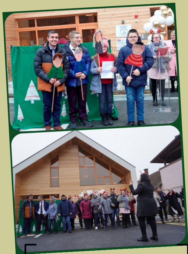
Program članova Udruge