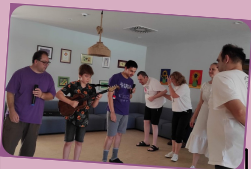
pjesma i ples