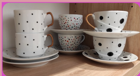
ŠALICE NOVIH UZORAKA