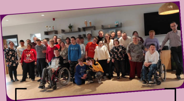
15. ožujka - prijatelji iz Udruge Latice Koprivnica kod nas