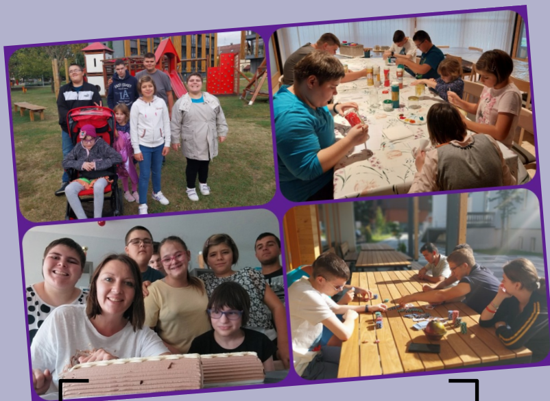
Proslava rođendana, šetnja gradom, društvene igre i kreativnost