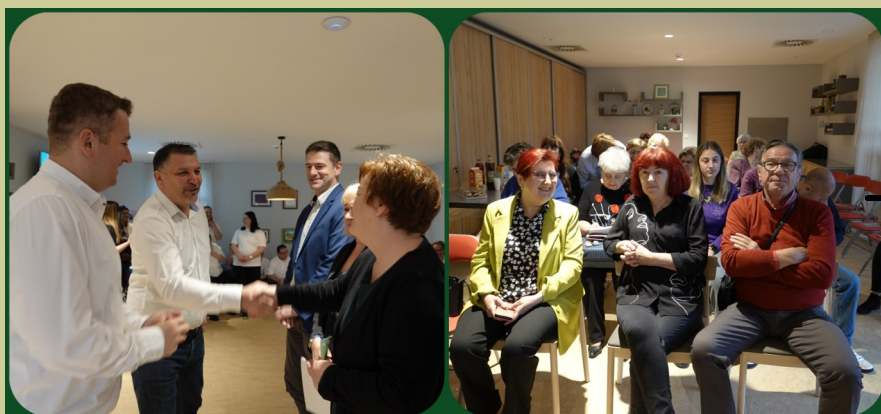
Doček i prijem gostiju