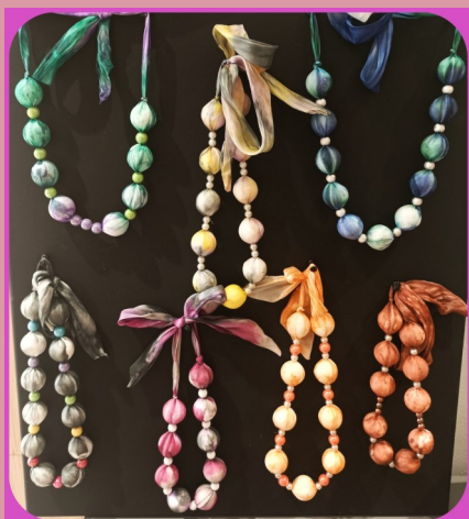
OGRVICE OD SVILE

Inovacije su među glavnim preduvjetima progresije - osobne i kolektivne te je dokaz uložnog truda, imaginacije i intelekta u napredak. Ne ulažemo samo trud u inovacije aktivnosti socijalnih usluga koje pružamo, već i u kreativne radove kojima se predstavljamo, a ovo su samo neke od ovogodišnjih.