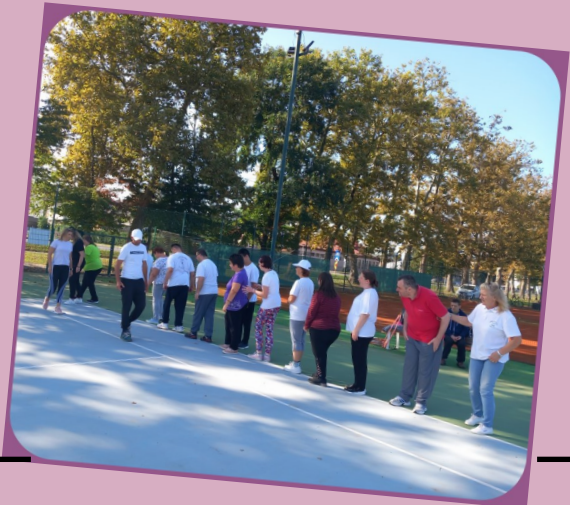
boravak na otvorenom