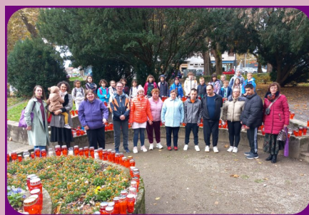
17. studeni - Dan tolerancije i Dan sjećanja na žrtve Domovinskog rata s područnim školama OŠ Đurđevac