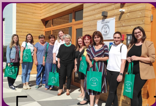
5. rujna - posjet djelatnica Hrvatskog zavoda za socijalni rad, podružnice Đurđevac