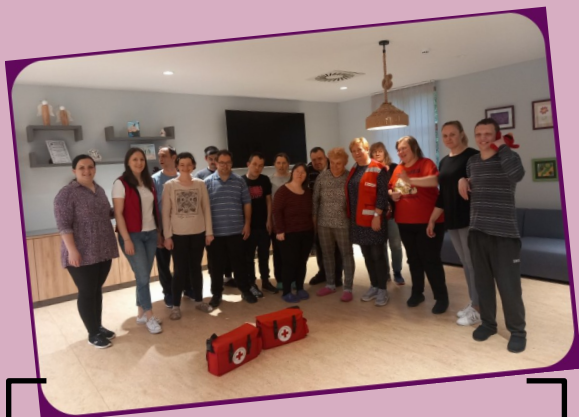
17. svibnja - posjet predstavnica Crvenoga križa