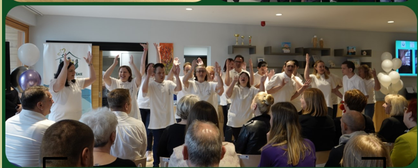
Uzbuđenje članova Udruge i njihov nastup