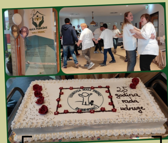
Proslava dvaju velikih događaja