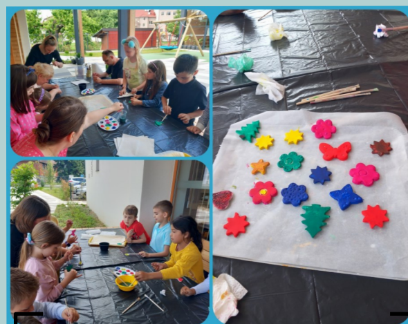
Izrada i bojanje glinenih ukrasa s 1. D razredom Osnovne škole Đurđevac