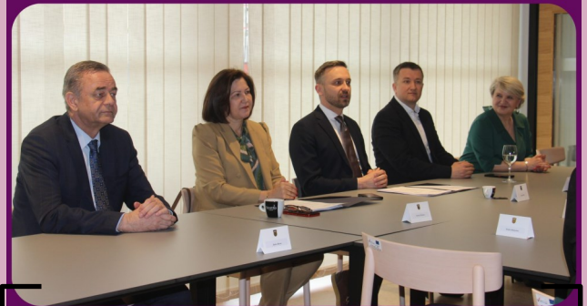
27. ožujka - 13. sjednica Nacionalnog vijeća za razvoj socijalnih politika u nazočnosti ministra rada, mirovinskog sustava, obitelji i socijalne politike