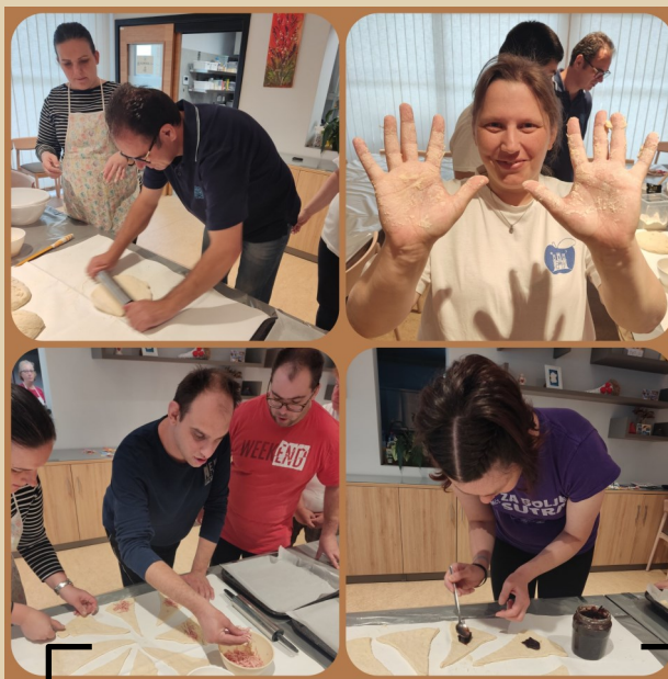
16. listopada - Svjetski dan hrane