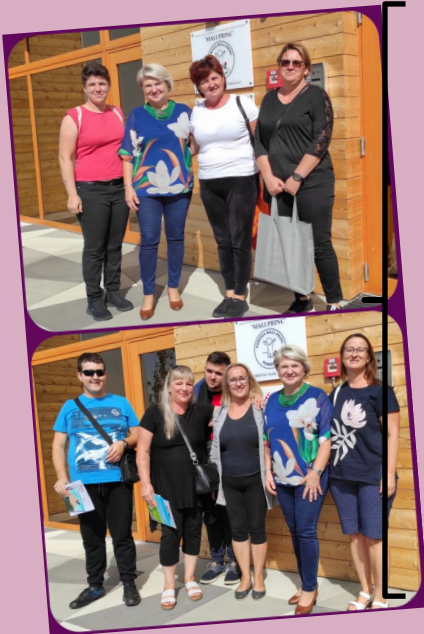
21. rujna - posjet članova novoosnovane udruge Budi mi prijatelj iz Virovitice za djecu s teškoćama u razvoju i osobe s invaliditetom