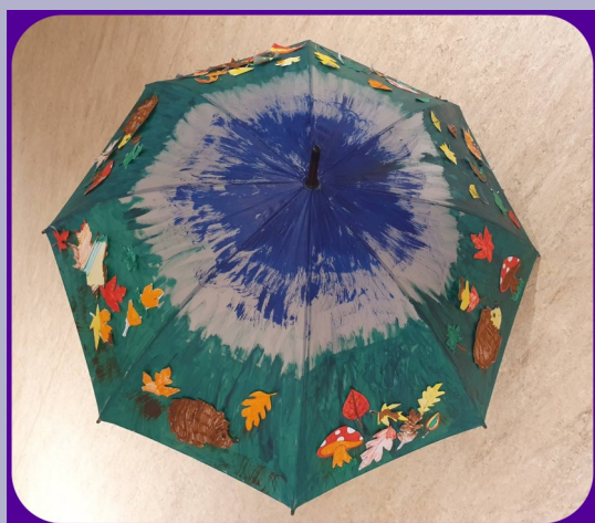
Kreativni jesenski kišobran nastao udruženim snagama djece školskoga uzrasta i članova poludnevnog boravka