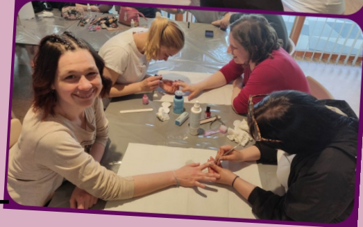
21. travnja - dolazak 2. D razreda Strukovne škole Đurđevac povodom radionice Brini o sebi u sklopu Tjedna cjeloživotnog učenja