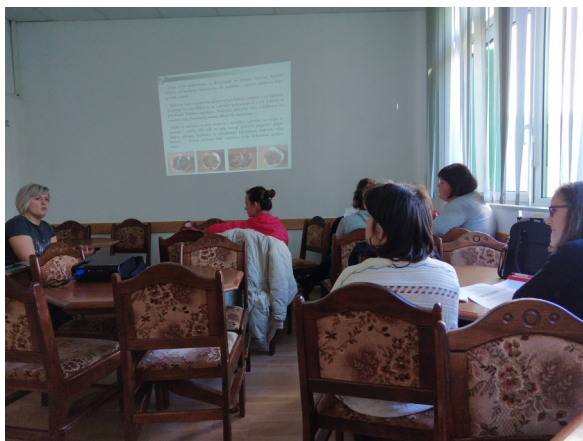
Predavanja nastavnog programa obrazovanja odraslih za poslove sakupljača, uzgajivača i prerađivača ljekovitog i aromatičnog bilja