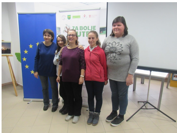
Početna konferencija projekta „Za bolje sutra“, sudionice

Projekt se provodi idućih 18 mjeseci odnosno do 21. travnja 2021.godine.Vrijednost projekta je 440.438,23 kn i 100% je financiran sredstvima Europskog socijalnog fonda. Partneri u projektu su Grad Đurđevac i Centar za socijalnu skrb Đurđevac.